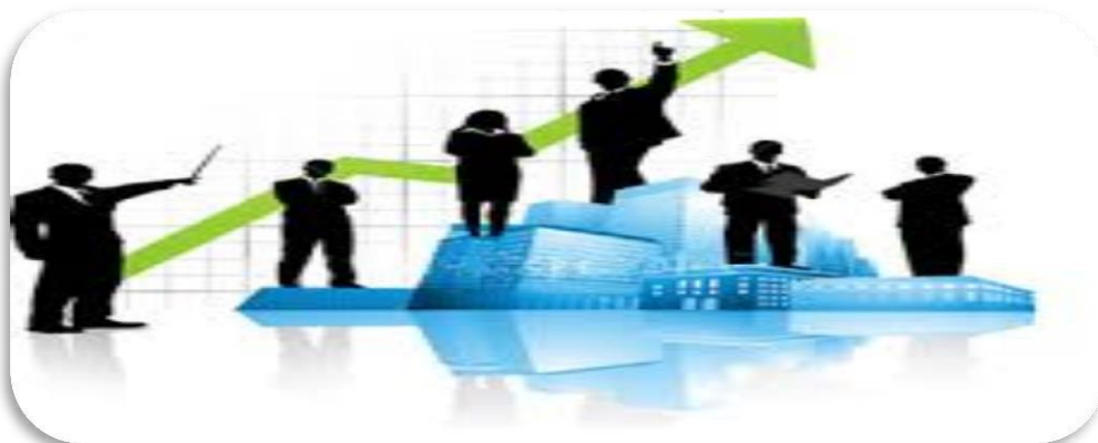
Gráfico de Desenvolvimento do Município