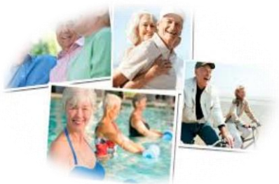
Juventude e Terceira Idade