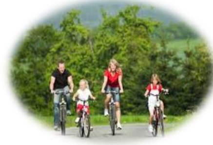
Cultura, Esporte e Lazer